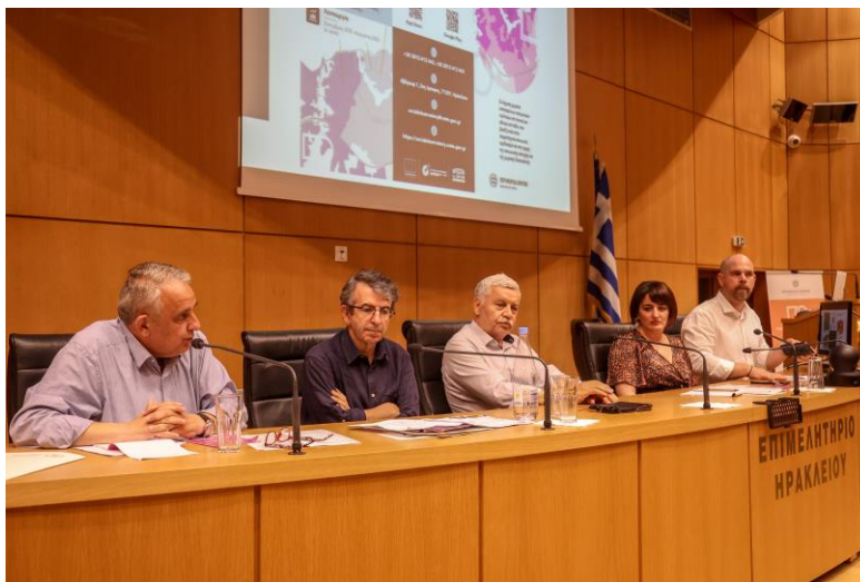
Φωτογραφία 16 Πάνελ στρογγυλής τράπεζας