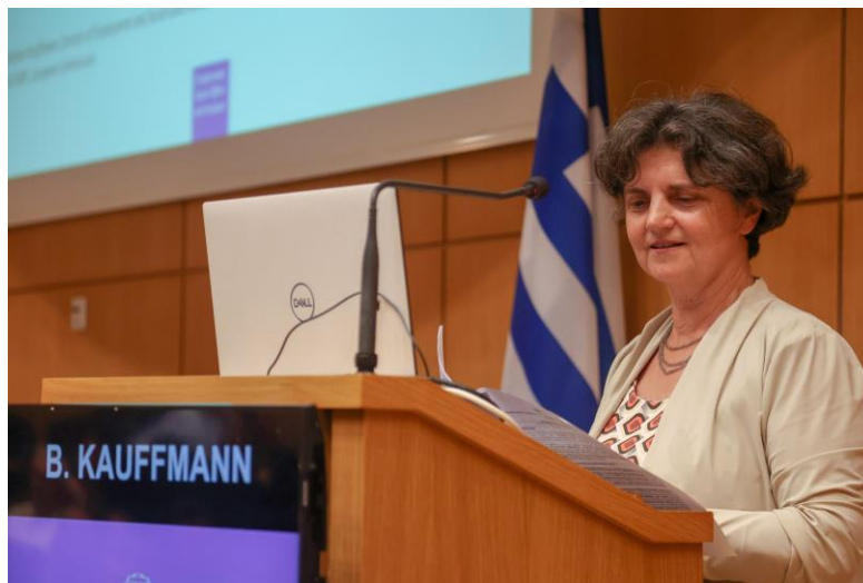
Φωτογραφία 12 Barbara Kauffmann

Η 1 η εισήγηση πραγματοποιήθηκε από την κα Barbara Kauffmann , Διευθύντρια Απασχόλησης και Κοινωνικής Διακυβέρνησης της Γενικής Διεύθυνσης Απασχόλησης, Κοινωνικών Υποθέσεων και Κοινωνικής Ένταξης της Ευρωπαϊκής Επιτροπής (Ε.Ε.), με τίτλο « Η Περιφερειακή διάσταση του Ευρωπαϊκού Πυλώνα Κοινωνικών Δικαιωμάτων ».