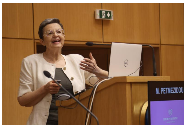
Φωτογραφία 6 Μαρία Πετμεζίδου

Ακολούθησε η εισήγηση της Ομότιμης Καθηγήτριας Κοινωνικής Πολιτικής, του τμήματος Κοινωνικής Διοίκησης και Πολιτικής Επιστήμης του Δημοκριτείου Πανεπιστημίου Θράκης, κας Μαρίας Πετμεζίδου , με τίτλο « Ενεργειακή φτώχεια, φτώχεια μετακίνησης και 'δίκαιη μετάβαση' ».