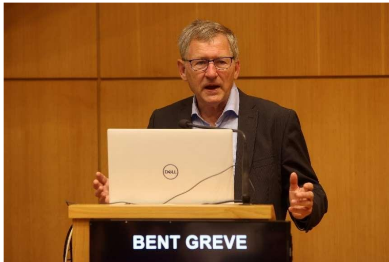
Φωτογραφία 4 Bent Greve

Η πρώτη εισήγηση έγινε από τον κ. Bent Greve , Καθηγητή Κοινωνικής Πολιτικής του Πανεπιστημίου Roskilde της Δανίας, με τίτλο « Πώς αντιμετωπίζεται η φτώχεια και η ανισότητα. Η εμπειρία του Σκανδιναβικού Κράτους Πρόνοιας ».