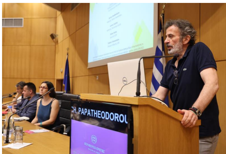
Φωτογραφία 8 Χρίστος Παπαθεοδώρου

Η πρώτη εισήγηση έγινε από τον κ. Χρίστο Παπαθεοδώρου , Καθηγητή Κοινωνικής Πολιτικής, Αντιπρύτανη Οικονομικών, Προγραμματισμού & Ανάπτυξης, του Παντείου Πανεπιστημίου, επιστημονικά υπεύθυνου του 1 ου Ερευνητικού Άξονα Ομάδας Πανεπιστημίου Κρήτης, με τίτλο «Ανισότητες και συνθήκες διαβίωσης στην Περιφέρεια Κρήτης: συγκρίσεις και τάσεις» .