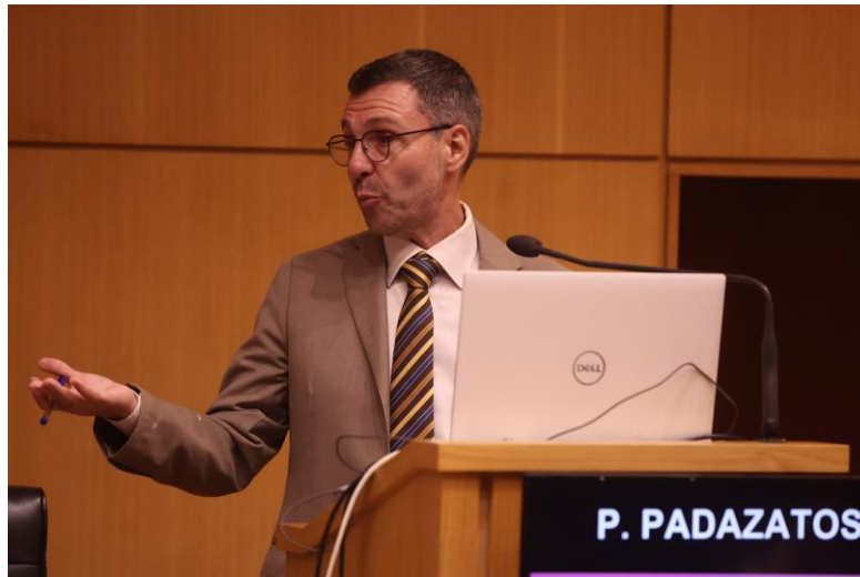
Φωτογραφία 13 Παναγιώτης Πανταζάτος

Η επόμενη εισήγηση πραγματοποιήθηκε από τον κ. Παναγιώτη Πανταζάτο , Αναπληρωτή Προϊστάμενο της Μονάδας «Ελλάδα-Κύπρος» της Γενικής Διεύθυνσης Περιφερειακής και Αστικής Πολιτικής της Ευρωπαϊκής Επιτροπής (Ε.Ε.) και αφορούσε τις «Στρατηγικές κοινωνικές επενδύσεις ΕΤΠΑ 2021-2027: κοινωνικοοικονομικές & χωρικές διαστάσεις» .