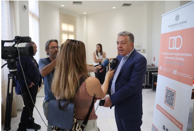
Φωτογραφία 2 Σταύρος Αρναουτάκης, Περιφερειάρχης Κρήτης

Αρναουτάκης συνεχάρη τα στελέχη της Περιφέρειας για τη διοργάνωση του συνεδρίου και το σύνολο των εισηγητών για τη συμβολή τους στην ενίσχυση του κοινωνικού δείκτη προστασίας.